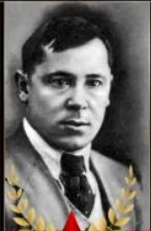
Муса Джалиль " Варварство "